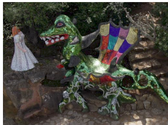
Niki de Saint Phalle